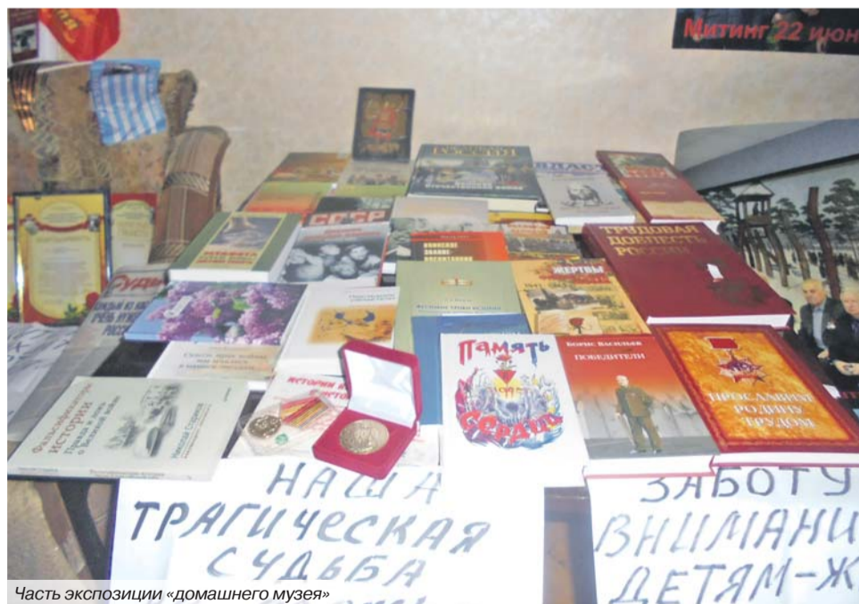
Часть экспозиции «домашнего музея»

Однако сегодня, к сожалению, когда-то поднятый для нас шлагбаум стал опускаться всё ниже и ниже.