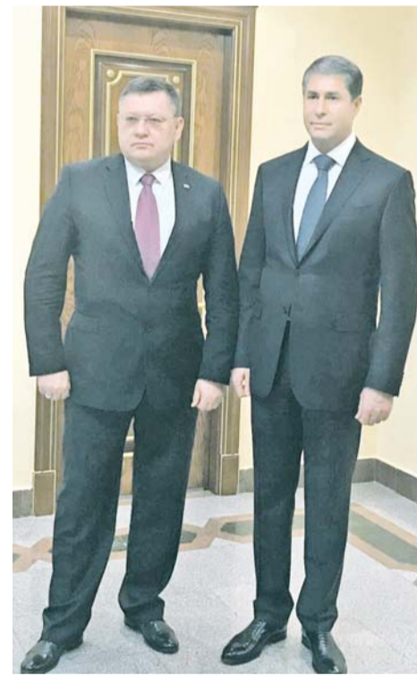
По материалам пресс-центра МВД России

В качестве одного из ключевых форматов российско-азербайджанского взаимодействия стороны отметили сотрудничество в рамках Совета министров внутренних дел государств - участников СНГ, очередное заседание которого запланировано на июнь 2017 года в г. Душанбе Республики Таджикистан.